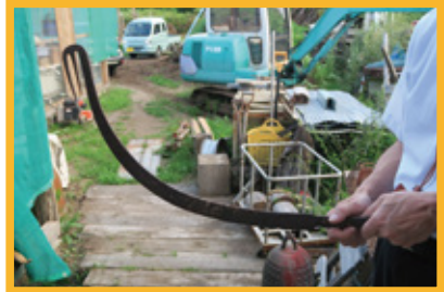
実際にお問い合わせのあったウナギ搔き

[ウナギ搔き] 水底のウナギを捕える道具。長い柄の先に鉤（カギ）をつけたもの。船上用と徒歩用の2種類あり、柄の長さや鎌の角度が異なる。