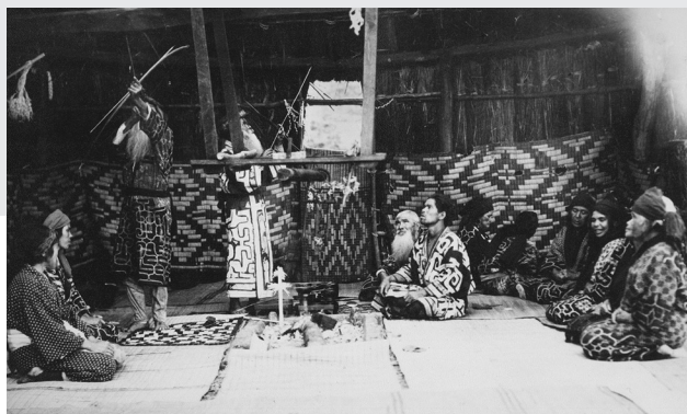
▲チセノミ(家・祈る・家の新築祝い)の様子