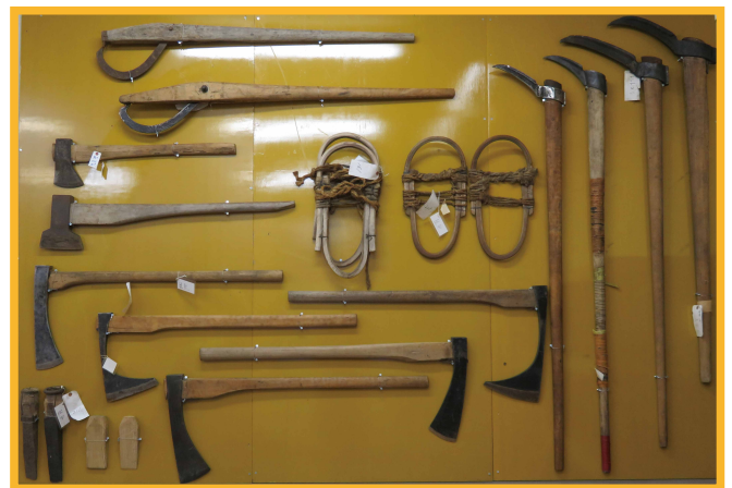
写真は左右いずれとも展示室「G林業・馬具」