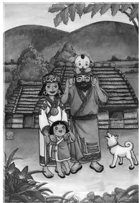
▲ 「ピラカとアツマの物語」(『アイヌの昔話集』[2001]) 語り: 上田とし、文: 川上勇治、絵: はまおかのりこ