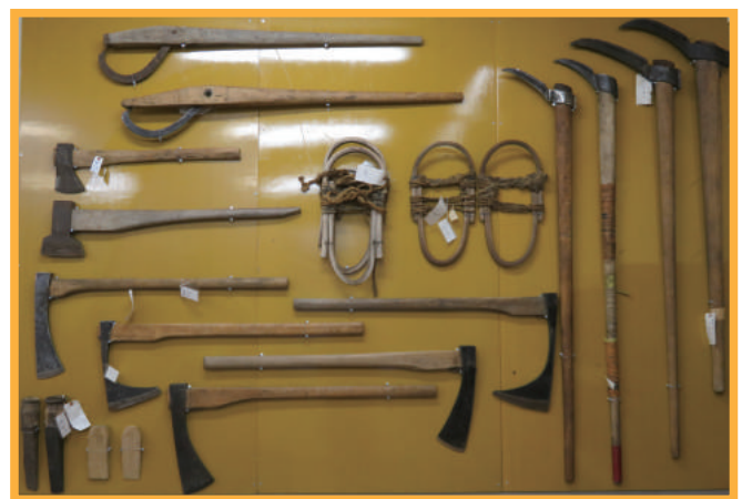
写真は左右いずれとも展示室「G林業・馬具」